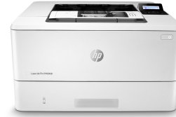
HP LaserJet Pro M404dn

Deze printer is ontworpen om alleen te werken met cartridges die een nieuwe of hergebruikte HP-chip hebben. De printer gebruikt dynamische beveiligingsmaatregelen om cartridges te blokkeren die een chip hebben die niet van HP is. Periodieke firmware-updates behouden de effectiviteit van deze maatregelen en blokkeren cartridges die eerder wel werkten. Met een hergebruikte HP-chip kunt u hergebruikte, gerecyclede en opnieuw gevulde cartridges gebruiken. Meer informatie vindt u op: http://www.hp.com/learn/ds