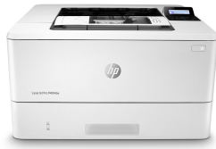
HP LaserJet Pro M404dw

Winnen in het bedrijfsleven betekent slimmer werken. De HP LaserJet Pro M404 printer is ontworpen zodat u zich kunt focussen op de groei van uw bedrijf en op het versterken van uw concurrentiepositie.