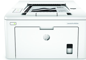
HP LaserJet Pro M203dw printer