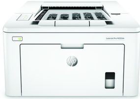
HP LaserJet Pro M203dn printer

Profiteer van meer pagina's, hogere prestaties en betere bescherming 1 met een draadloze HP LaserJet Pro met JetIntelligence-tonercartridges. Maak uw bedrijf sneller: print direct dubbelzijdige documenten en beheer eenvoudig om efficiënter te werken.