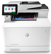
HP Color LaserJet Pro M479dw

Winnen in het bedrijfsleven betekent slimmer werken. De HP Color LaserJet Pro MFP M479 is ontworpen om u te laten focussen op de meest effectieve manier om uw bedrijf te laten groeien en de concurrentie voor te blijven.