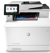
HP Color LaserJet Pro M479fnw

Deze printer is ontworpen om alleen te werken met cartridges die een nieuwe of hergebruikte HP-chip hebben. De printer gebruikt dynamische beveiligingsmaatregelen om cartridges te blokkeren die een chip hebben die niet van HP is. Periodieke firmware-updates behouden de effectiviteit van deze maatregelen en blokkeren cartridges die eerder wel werkten. Met een hergebruikte HP-chip kunt u hergebruikte, gerecyclede en opnieuw gevulde cartridges gebruiken. Meer informatie vindt u op: http://www.hp.com/learn/ds