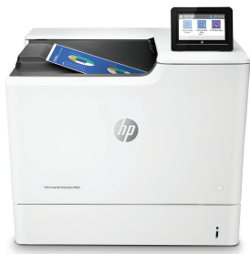
HP Color LaserJet Enterprise M653dn

Deze HP LaserJet kleurenprinter met JetIntelligence combineert een uitzonderlijke performance en energie-efficiëntie met de professionele documentkwaliteit die u nodig heeft en beschermt uw netwerk met de meest optimale beveiliging in de industrie. 1